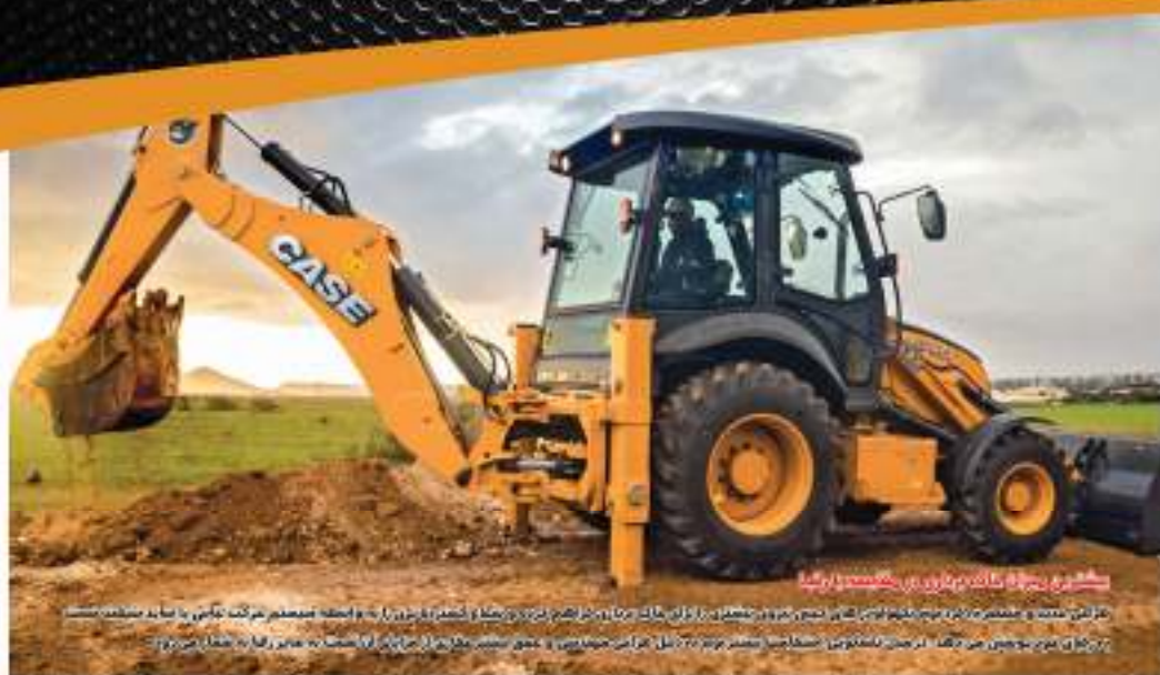
مشتریان بزرگ ما در ایران، چین، روسیه، هند و آفریقا با استفاده از موتورهای CASE با اطمینان و رضایت بسیار بالا از عملکرد و قابلیت‌های این ماشین‌ها استفاده می‌کنند.